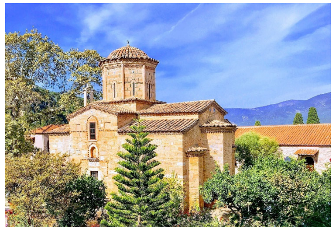
Kloster Loukous CCBYSA4.0 Nikos R Kambylis at-wikimedia.commons

Am späten Nachmittag besuchen Sie das Weingut Bairaktaris bei Nemea. Das besondere Mikroklima und die lehmigen, fruchtbaren Böden bieten die ideale Basis zur Herstellung ausgezeichneter Weine . Bei einer Führung durch die Weinkellerei erfahren Sie interessante Details zur Philosophie des traditionsreichen Familienunternehmens . Lassen Sie sich bei der Verkostung verschiedener Weine von deren Qualität überzeugen!