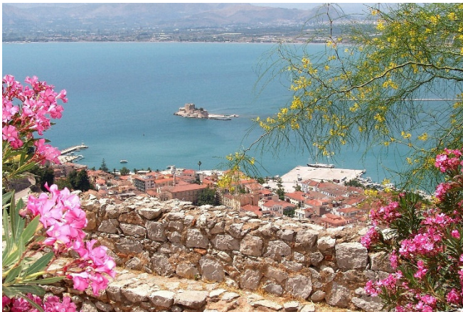
Blick auf Nauplia

Anschließend besichtigen Sie die Ausgrabungen von Alt-Korinth . Die ideale Lage am Isthmus, der Landenge zwischen dem Peloponnes und dem Festland, machte die Stadt in der Antike zu einem wichtigen Handelsplatz. Sie besichtigen die Ruinen des Apollon-Tempels und spazieren über die Lechaion-Straße zur Agorá , dem Marktplatz der antiken Stadt. Hier steht auch das Bema, eine Rednertribüne, von der der Apostel Paulus zu den Korinthern gesprochen haben soll.