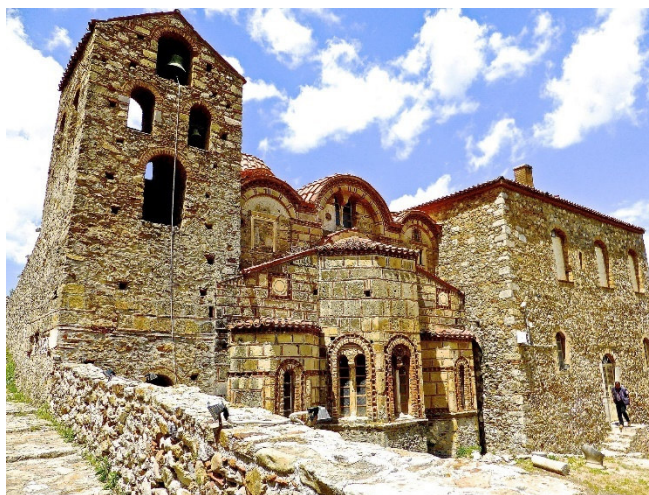
Agios Dimitrios in Mystras

Gemeinsames Abendessen in einer Taverne.