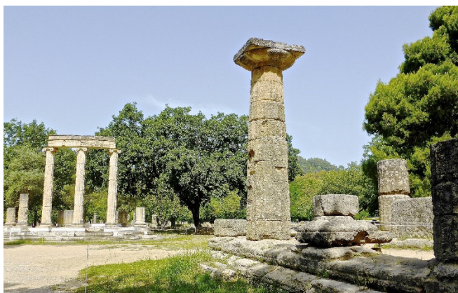
Olympia CC0 at-pixabay