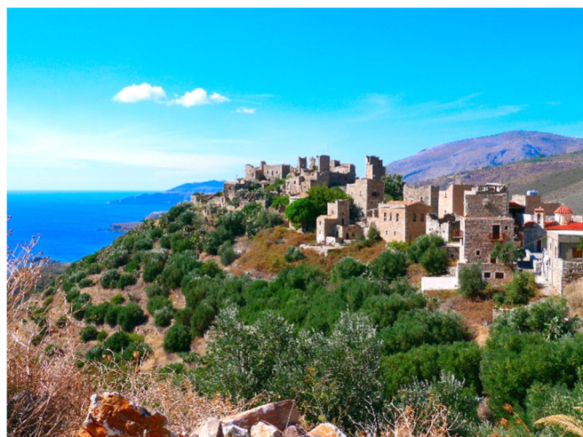
Vathiá CCBYSA4.0 Camster at-wikimedia.commons