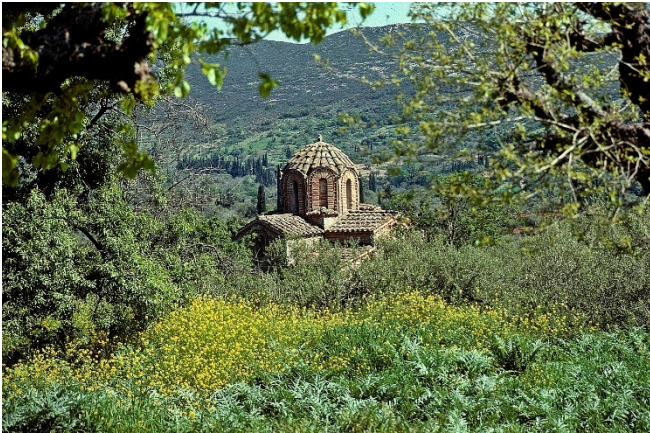
Agios Sozon in Geraki

Flug von Düsseldorf nach Athen (andere Abflughäfen auf Anfrage). Nach der Ankunft am Nachmittag Begrüßung durch Ihre örtliche Reiseleitung und Fahrt zu Ihrem Hotel bei Nauplia am Golf von Argolis. Zimmerbezug für 1 Übernachtung. Mit einem gemeinsamen Abendessen im Hotel klingt der Tag aus.