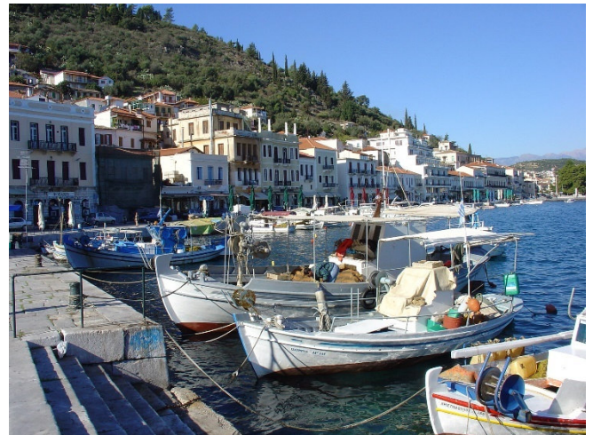
Hafen von Gythio

Zum gemeinsamen Abendessen werden Sie in einer typisch griechischen Taverne erwartet.