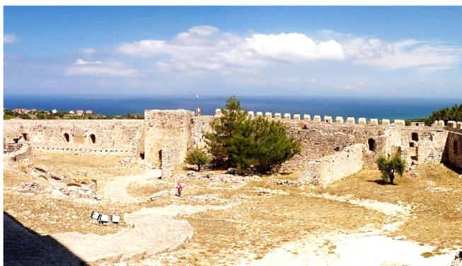
Burg Chlemoutsi

Nach einer individuellen Mittagspause führt ein Ausflug auf die Halbinsel Kyllini, den nordwestlichsten Teil des Peloponnes. Mit der Festung Chlemoutsi besichtigen Sie eine der größten Burgen Griechenlands! Das von französischen Kreuzrittern im 13. Jh. errichtete Bauwerk thront weithin sichtbar auf einem Hügel und ist nahezu vollkommen erhalten geblieben. In den mittelalterlichen Hallen der Burg ist ein Museum untergebracht, das sich u. a. mit dem westlichen Einfluss auf die orthodoxe Kirchenarchitektur beschäftigt. Von der Wehrmauer bietet sich ein grandioser Panoramablick auf die Küste und das Ionische Meer .